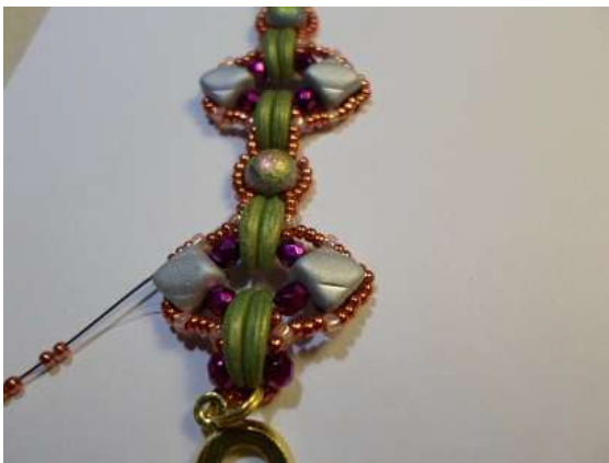
13. A másik oldalon is megfűzzük a Silkykre a díszítést és a kari másik végére is ráfűzzük az akasztórészt!

A karkötőhöz található medál mintáját itt tudod megvásárolni: