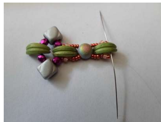
6. 15/o, 11/o, 15/o öltés a Crescentbe, majd át a kásákon és ki a 2db Crescenten.