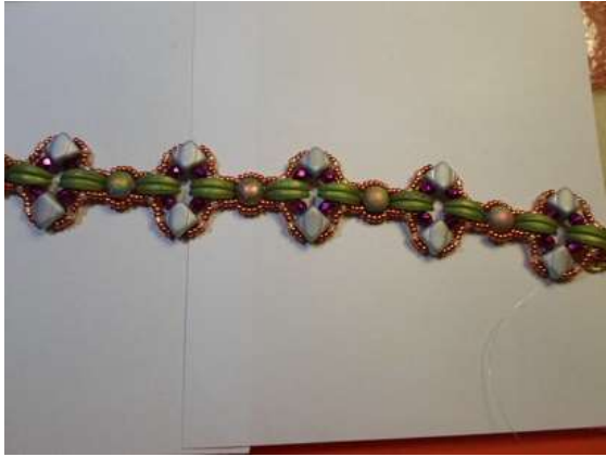
11. A másik oldalon is fűzd meg a kásás díszítés!