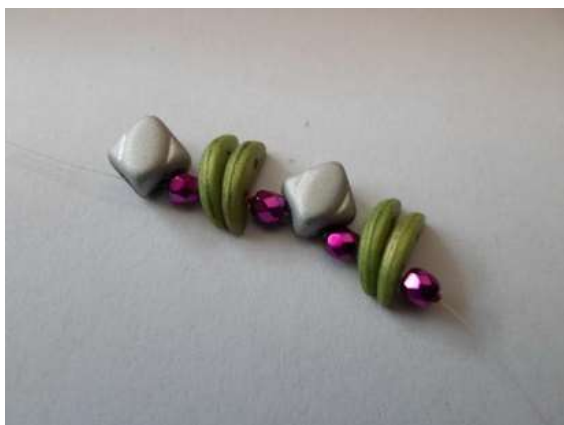
1. Silky, 3 mm csiszi, 2db Crescent, 3mm csiszi, silky, 3mm csiszi, 2 db Crescent, 3mm csiszi