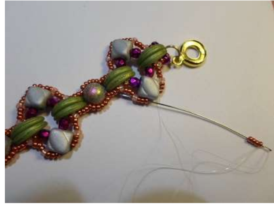
12. A kásával díszített soron újra végig megyünk és a Silkyk köré 4db 15/o kását fűzzünk.