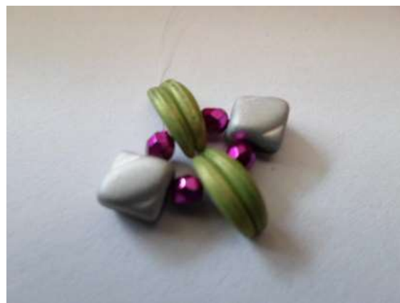
2. Alkoss kört, Raw technikával dolgozz! Az egyik 2 db Crescentből gyere ki!