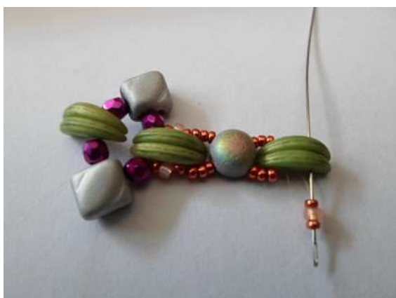
5. 15/o, 11/o, 15/o öltés a Crescent másik lyukába.