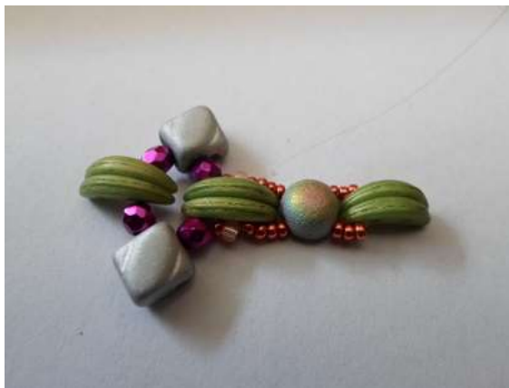
4. 3db 15/o, Cabochon, 3db 15/o, majd szúrd fenékbe a kiinduló Crescentet, majd halad át a kásákon a Cabochonig, menj át a Cabochon másik lyukába.