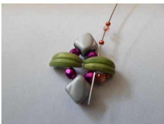
3. 15/o, 11/o, 15/o öltés a Crescent másik lyukába, majd 15/o, 11/o, 15/o, újra a Crescent másik lyukába, majd még egyszer fűzz át az első Crescenten lévő 3db kásán és öltés bele a Crescentbe.